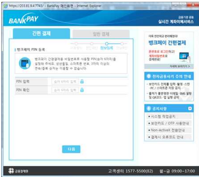
⑦ PIN 설정