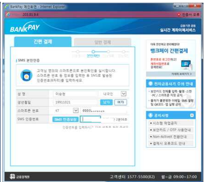
④ SMS 본인확인