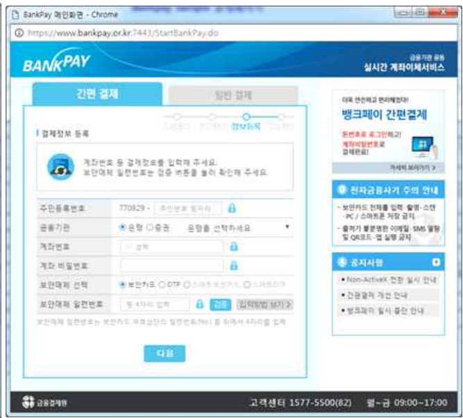
⑥ 결제정보 입력 및 검증