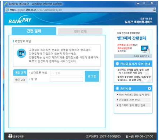
② 가입여부 확인(스마트폰번호+성명)