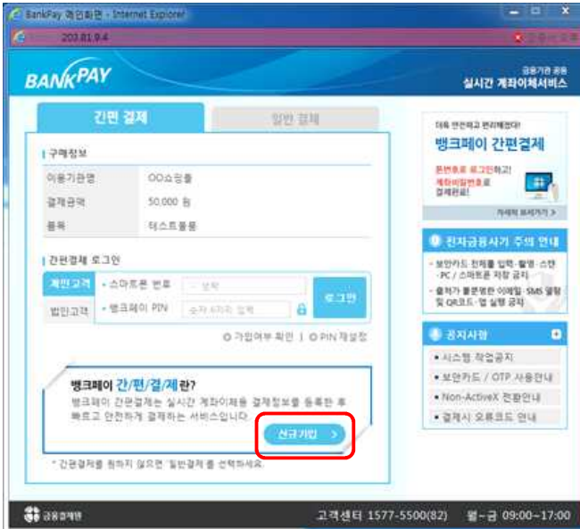
① [신규가입] 선택