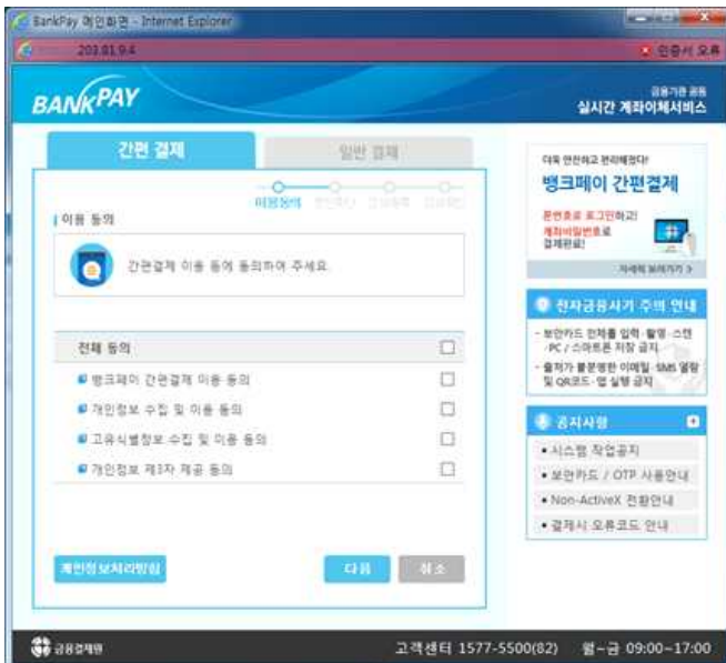
③ 서비스이용/정보수집 동의