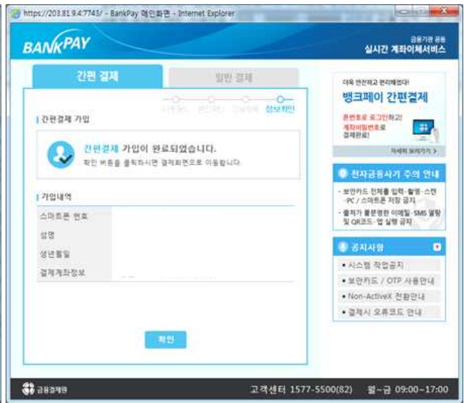
⑧ 가입 완료

※ 뱅크페이 홈페이지( www.bankpay.or.kr )의 [간편결제] 메뉴에서 회원가입 가능